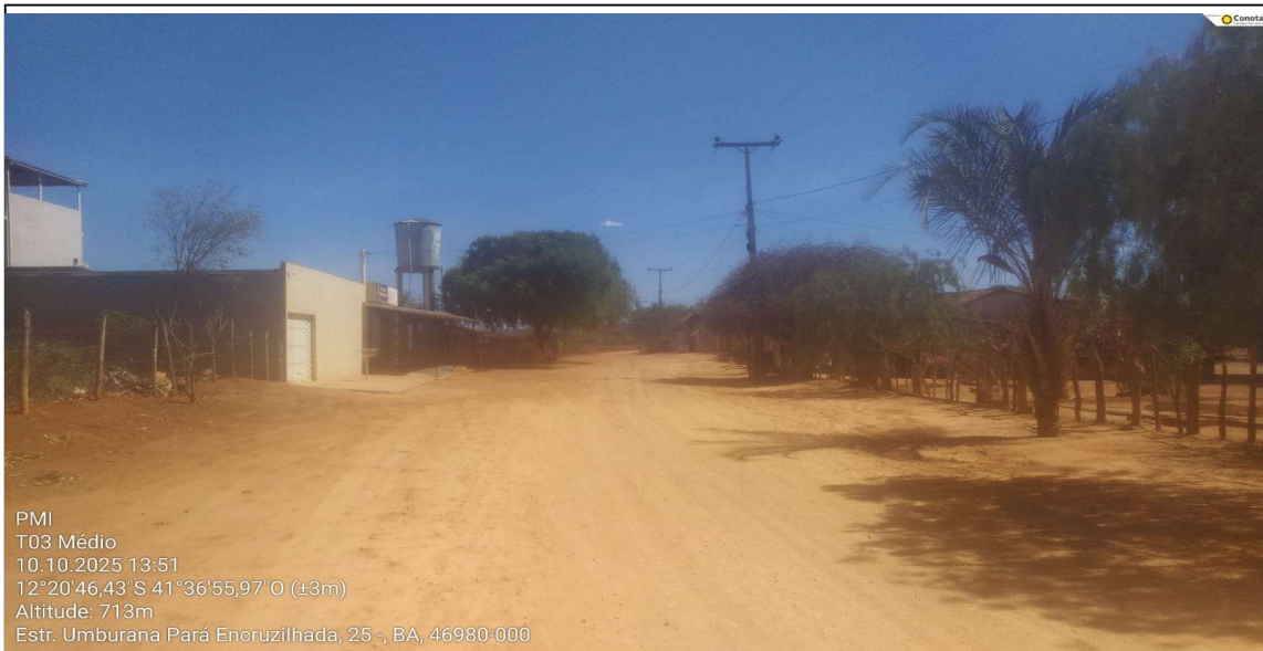
MÉDIO TRECHO 03

PMI T03 Médio 10.10.2025 13:51 12°20'46,43" S 41°36'55,97" O (±3m) Altitude: 713m Estr. Umburana Pará Encruzilhada, 25 -, BA, 46980-000