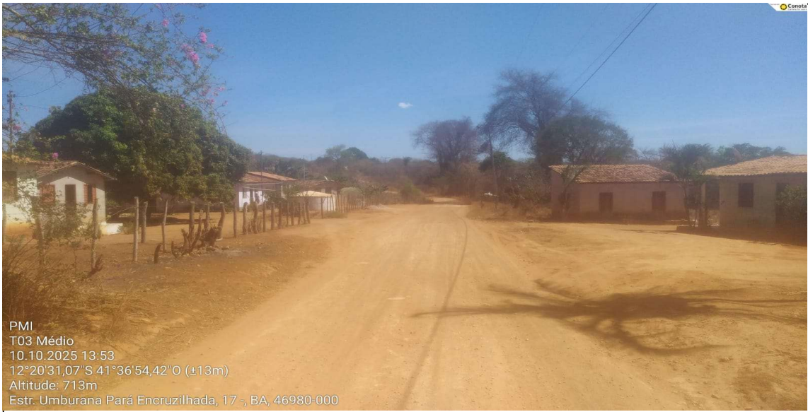
MÉDIO TRECHO 3

PMI T03 Médio 10.10.2025 13:53 12°20'31,07" S 41°36'54,42" O (±13m) Altitude: 713m Estr. Umburana Pará Encruzilhada, 17 -, BA, 46980-000