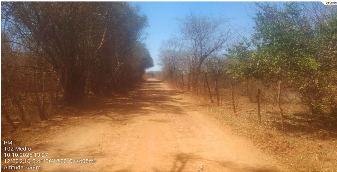
MÉDIO DO TRECHO 2

PMI T02 Médio 10.10.2025 13:27 12°20'2,16"S 41°36'12,80"O (±405m) Altitude: 698m