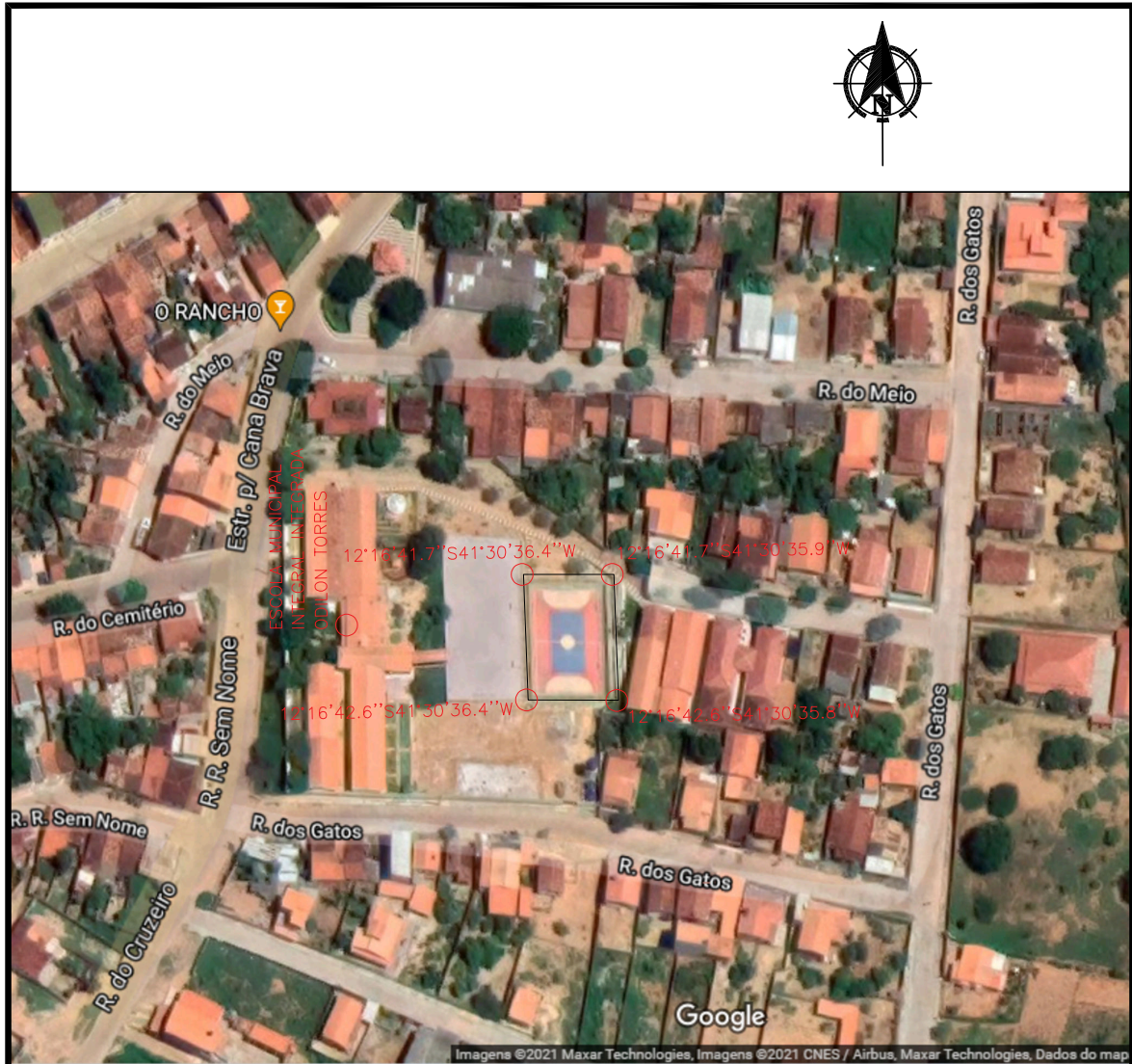
PLANTA DE LOCALIZAÇÃO - ESCALA 1:1500