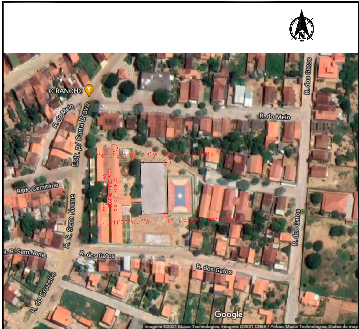
PLANTA DE LOCALIZAÇÃO - ESCALA 1:1500