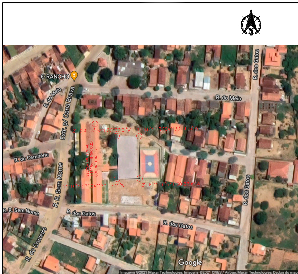
PLANTA DE LOCALIZAÇÃO - ESCALA 1:1500