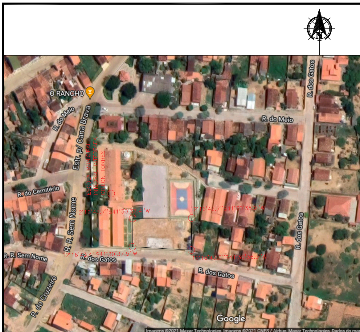
PLANTA DE LOCALIZAÇÃO - ESCALA 1:1500