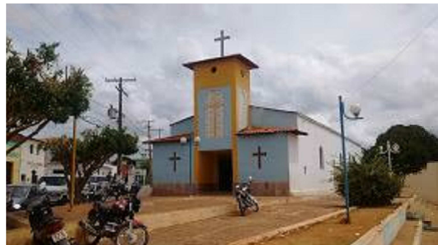
LOCAL DE REFERÊNCIA PROJETUAL: Igreja Nossa Senhora do Livramento