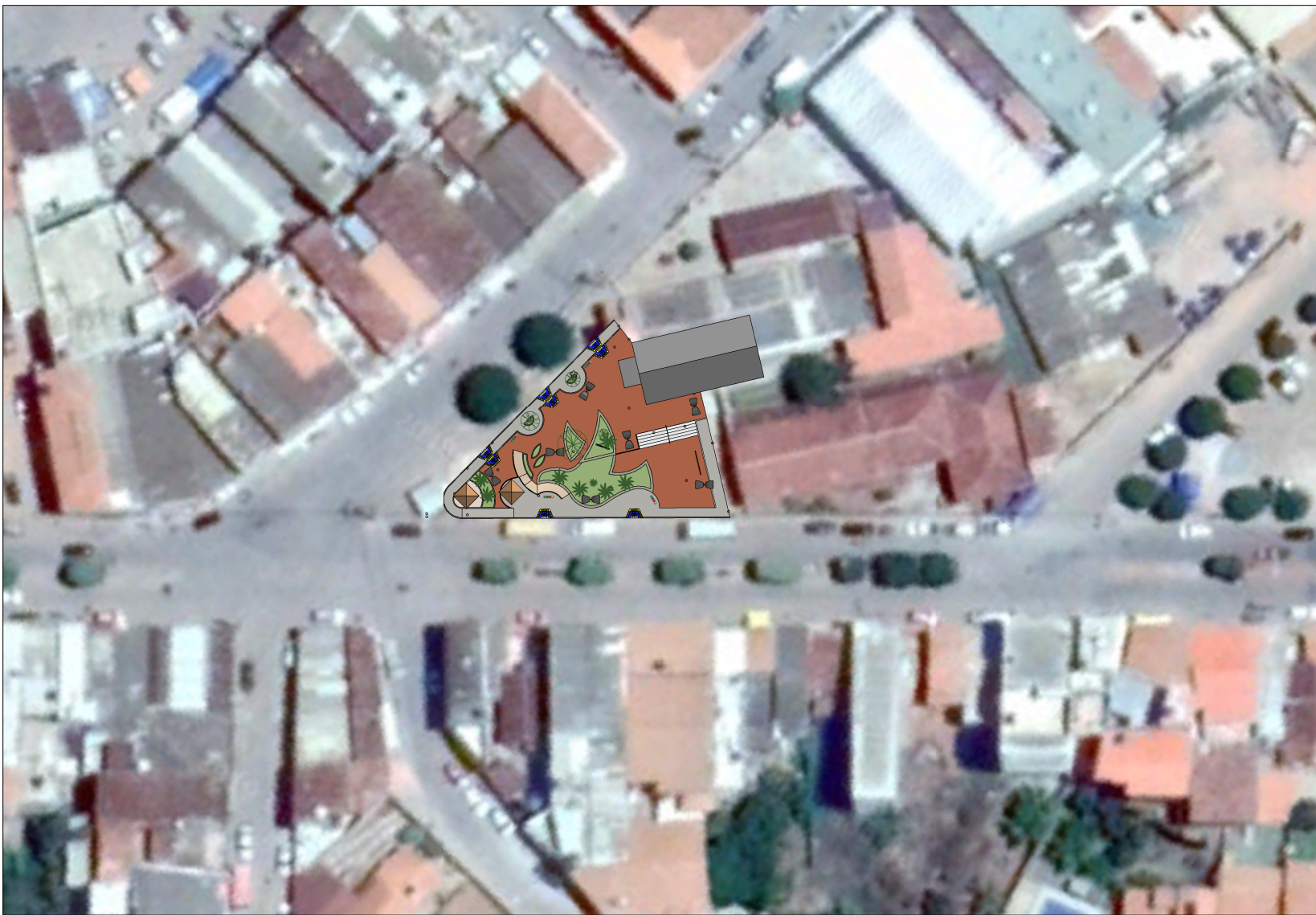
1 SITUAÇÃO ESCALA - 1 : 1000